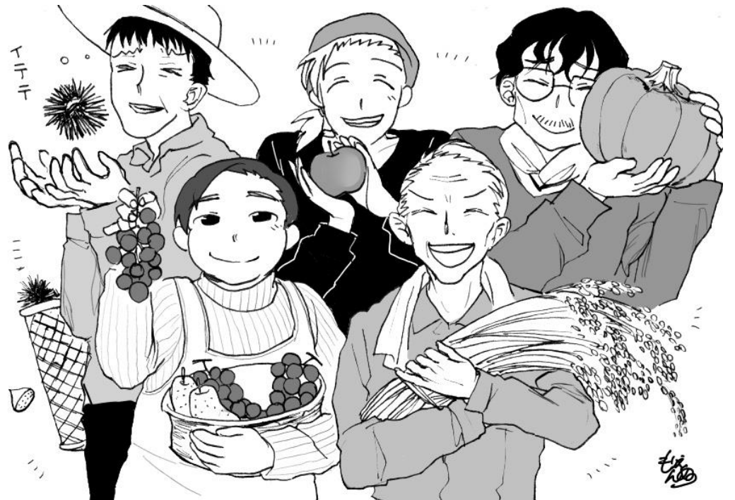
テーマ/収穫 絵/木更津市在住大学生 もりえんぬ